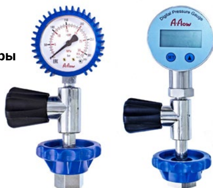
Манометр с трубкой Бурдона